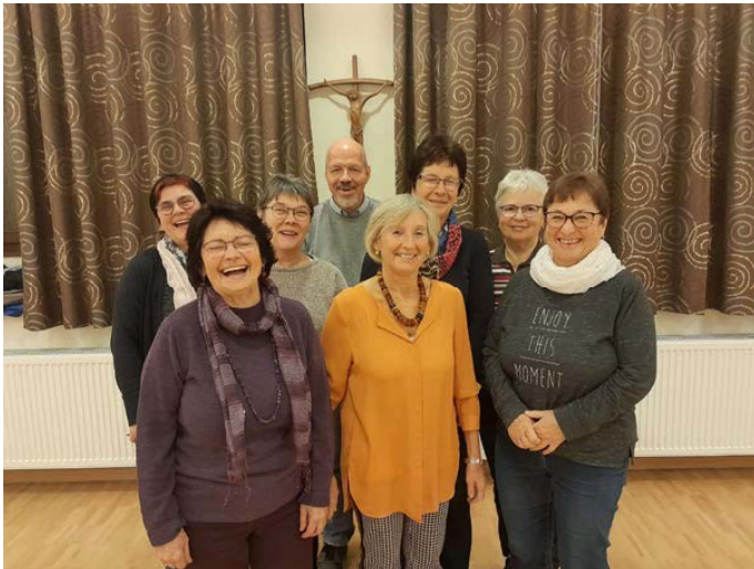
Bericht und Foto: Susanne Gallas

Nach den Grußworten von Pater Artur, der sich bei dem Kirchenchor für die Mitgestaltung der Gottesdienste bedankte und den Worten von Herrn Henning, fand der Abend beim gemütlichen Beisammensein mit ca. 40 Chormitgliedern seinen Abschluss.