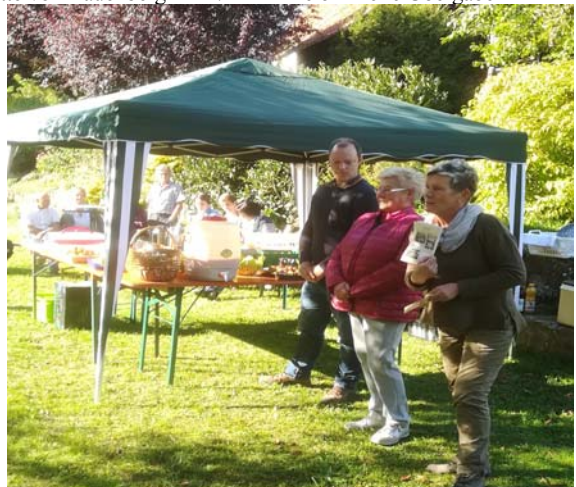
Die offizielle Übergabe