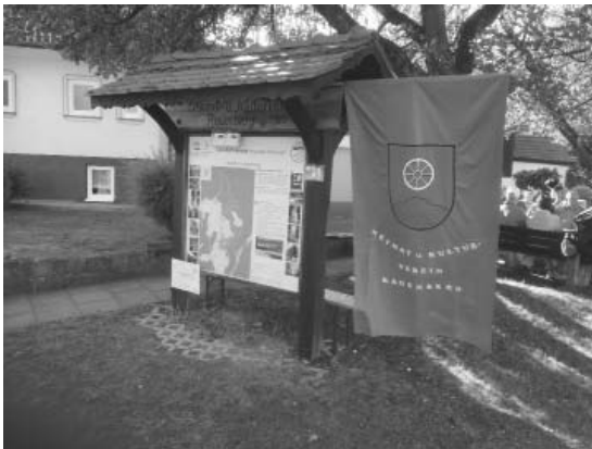
Die neue Wandertafel in der Ortsmitte von Rauenberg

An der Tafel in der Rauenberger Ortsmitte wurde mit zahlreichen Gästen nach kurzen Ansprachen diese offiziell übergeben. Der Verein lud alle Anwesenden zu einem kleinen Umtrunk und diversen Häppchen ein.