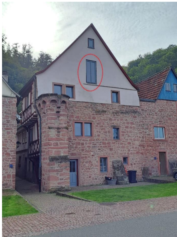
a) Französischer Balkon aus Edelstahl (Beispiel)

Ursprünglich war der Einbau eines Fensters mit festverglastem Unterlicht an dieser Stelle beantragt. Die Denkmalfachbehörde hat am 17.11.22 mitgeteilt, dass die Vergrößerung des Giebelfensters nach unten umgesetzt werden kann, das neue Fenster aber zweiflügelig und ohne Unterlicht ausgeführt werden soll, nachdem ein verglastes Unterlicht nicht genehmigungsfähig ist.