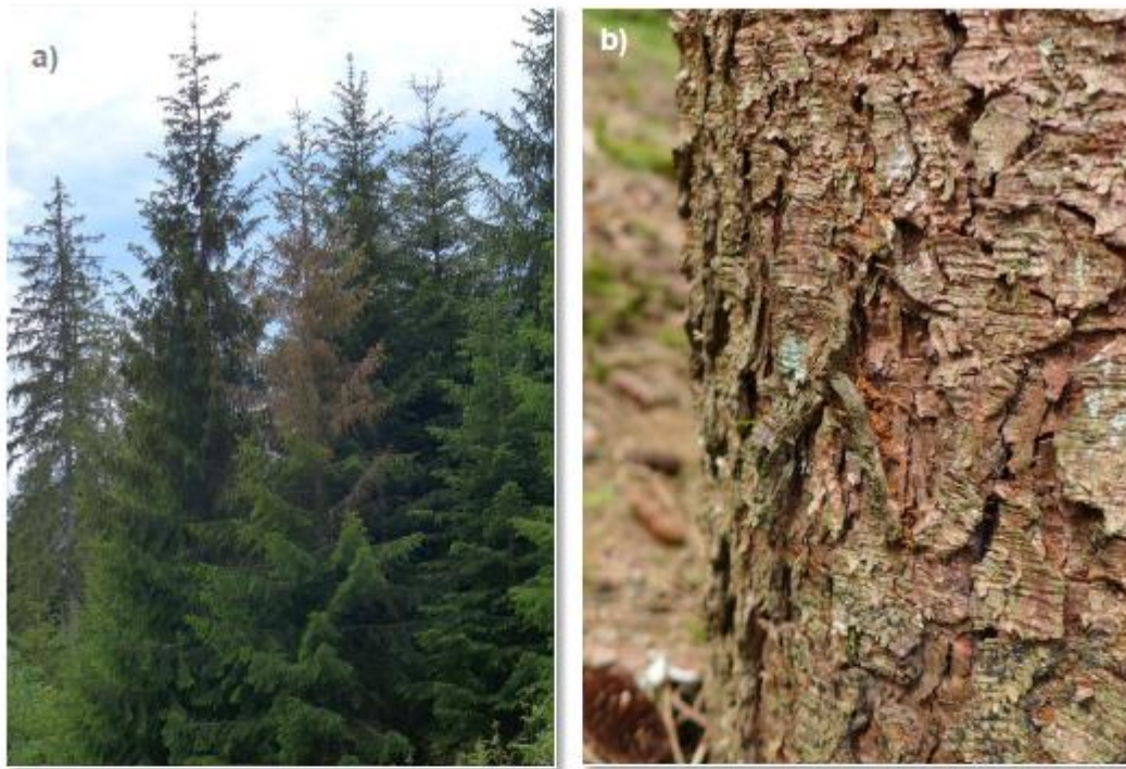
Abb. 2: Aktuelle Beobachtungen aus dem NLP: (a) frischer Kupferstecher-Befall, die Krone verfärbt sich bereits deutlich; (b) Bohrmehl nach Buchdrucker-Befall hinter Rindenschuppen erfordert genaueres Hinschauen