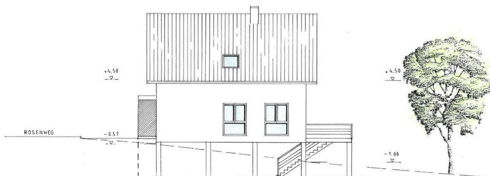
NORD – WEST – ANSICHT