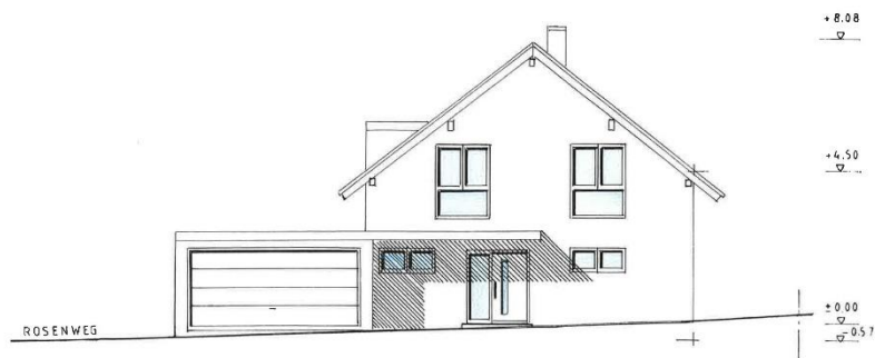
NORD – OST – ANSICHT

Für die vorgelegte Planung wird in den folgenden Punkten die Befreiung nach § 31 BauGB von den Festsetzungen des Bebauungsplanes benötigt: