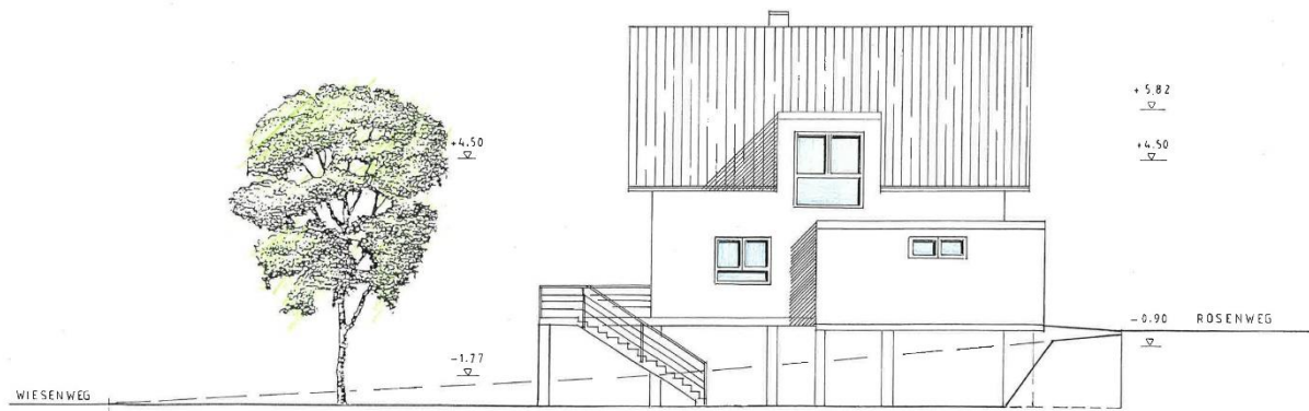
SÜD – OST – ANSICHT