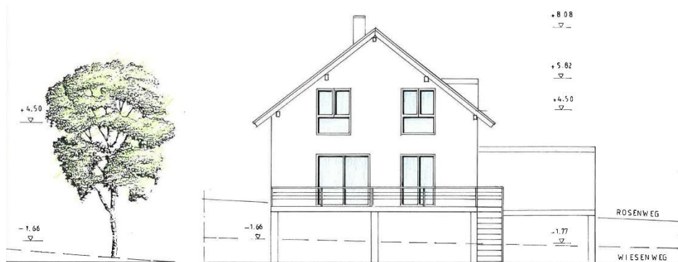
SÜD – WEST – ANSICHT