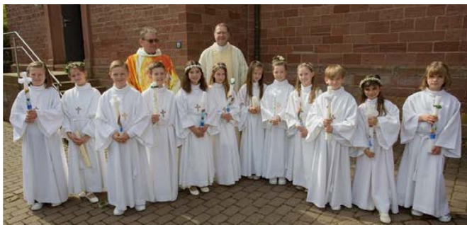
Die Erstkommunionkinder 2024 aus Boxtal, Rauenberg & Ebenheid

DANKE an alle Mitwirkenden für die feierliche Gestaltung unseres schönen Festgottesdienstes am 07.04.2024 in Freudenberg und am 14.04.2024 in Rauenberg.