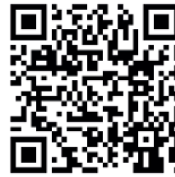
QR-Code Meine Umwelt-App

Weitere Informationen zur Asiatischen Hornisse und wie sich die Art von heimischen Insekten unterscheiden lässt finden sich auf der Homepage der LUBW https://www.lubw.baden-wuerttemberg.de/natur-und-landschaft/asiatische-hornisse sowie auf der Homepage der Landesanstalt für Bienenkunde der Universität Hohenheim unter https://bienenkunde.uni-hohenheim.de/vespavelutina . Dort finden sich auch weitere Informationen, wie Bürgerinnen und Bürger aktiv bei der Suche nach Tieren und Nestern mitwirken können. Seit April 2024 koordiniert die Landesanstalt für Bienenkunde in Stuttgart-Hohenheim im Auftrag der Naturschutzverwaltung das landesweite Management der Asiatischen Hornisse (Kontakt siehe Homepage).