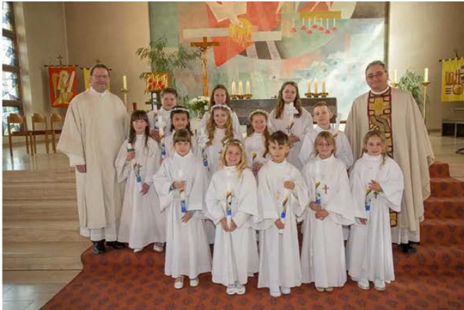
Die Erstkommunionkinder 2024 aus Freudenberg

DANKE an ALLE , die an uns gedacht haben, für die vielen Glückwünsche und Aufmerksamkeiten anlässlich unserer 1. Heiligen Kommunion, auch im Namen unserer Eltern.