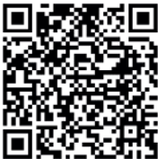
QR-Code Meldeplattform Asiatische Hornisse

für Umwelt, Klima und Energiewirtschaft um Meldung von Sichtungen in Baden-Württemberg. Dies ist über die Meldeplattform auf der Homepage der Landesanstalt für Umwelt (LUBW), aber auch über die kostenlose „Meine Umwelt-App“ möglich: