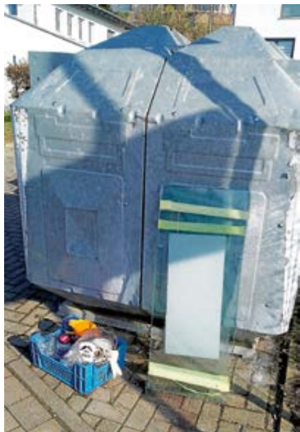
Illegal entsorgter Restmüll am Glascontainer

Liebe Mitbürgerinnen und Mitbürger, wir bitten Sie dringend darum, an den Glascontainern keinen Restmüll zu entsorgen!