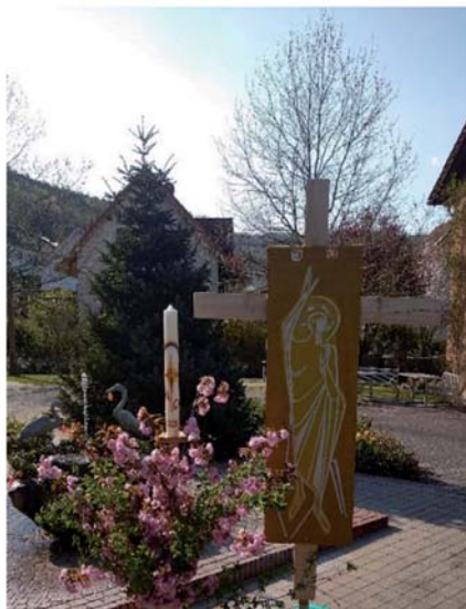
Bild vom Ostergottesdienst 2020 im Otto-Rauch-Stift

Wer sich auf Jesus einlässt, sich seiner Botschaft öffnet, der kann dies erfahren. Eine wunderbare Erfahrung, die uns bewahrt, den Kopf in den Sand zu stecken und stattdessen hoffnungsfroh nach vorne zu blicken. IGN Halleluja