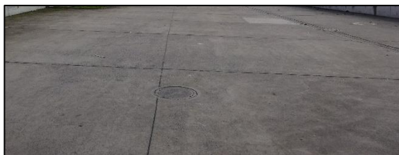
Abb. 5: Mit Betonplatten versiegelte Fläche innerhalb des Plangebiets