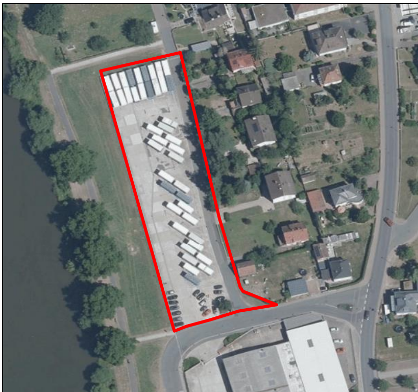
Abb. 1: Lage des Plangebietes (rot umrandet).