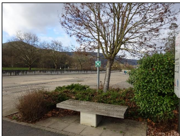
Abb. 3: Parkbank mit Gehölzen im Südosten des Plangebiets.

Hinweise auf geschützte Pflanzenarten und Rote-Liste-Arten sind nicht vorhanden.