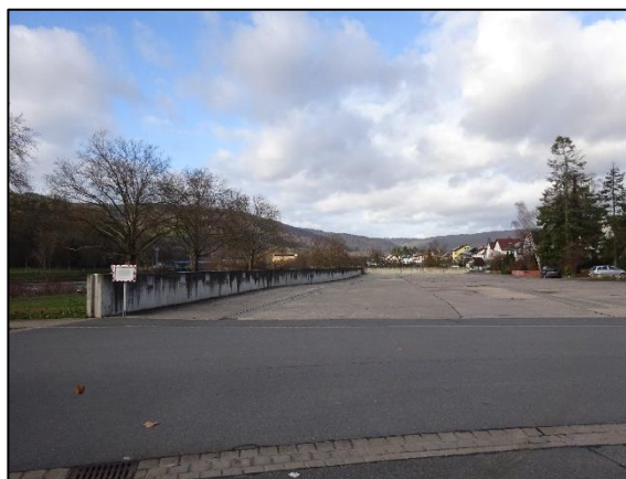
Abb. 4: Blick von Süden auf das Plangebiet