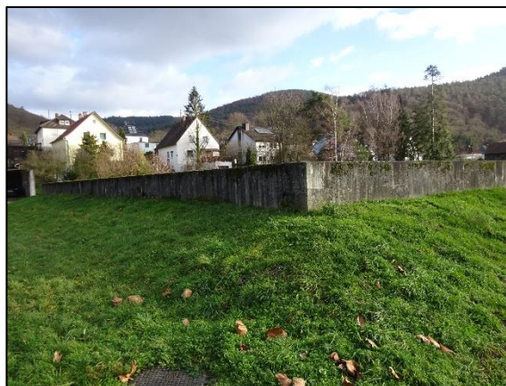
Abb. 6: Einfriedung des Plangebiets im Nordwesten